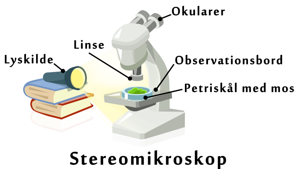
Figur 1. Her ses opstillingen til forsøget. Petriskålen placeres på stereomikroskopets observationsbord og der lyses ind på den fra siden.